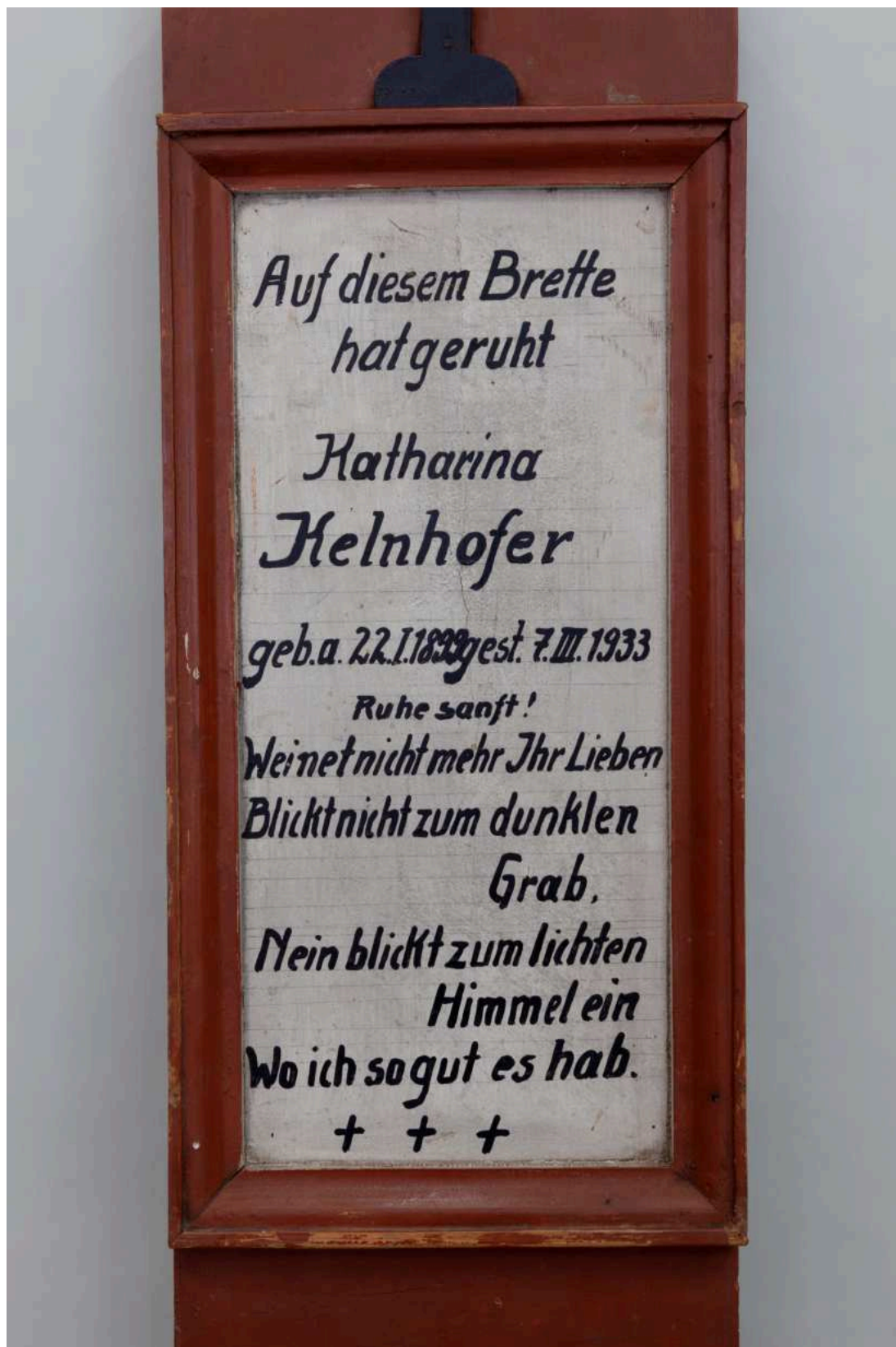
Stav před restaurováním - nápisová deska