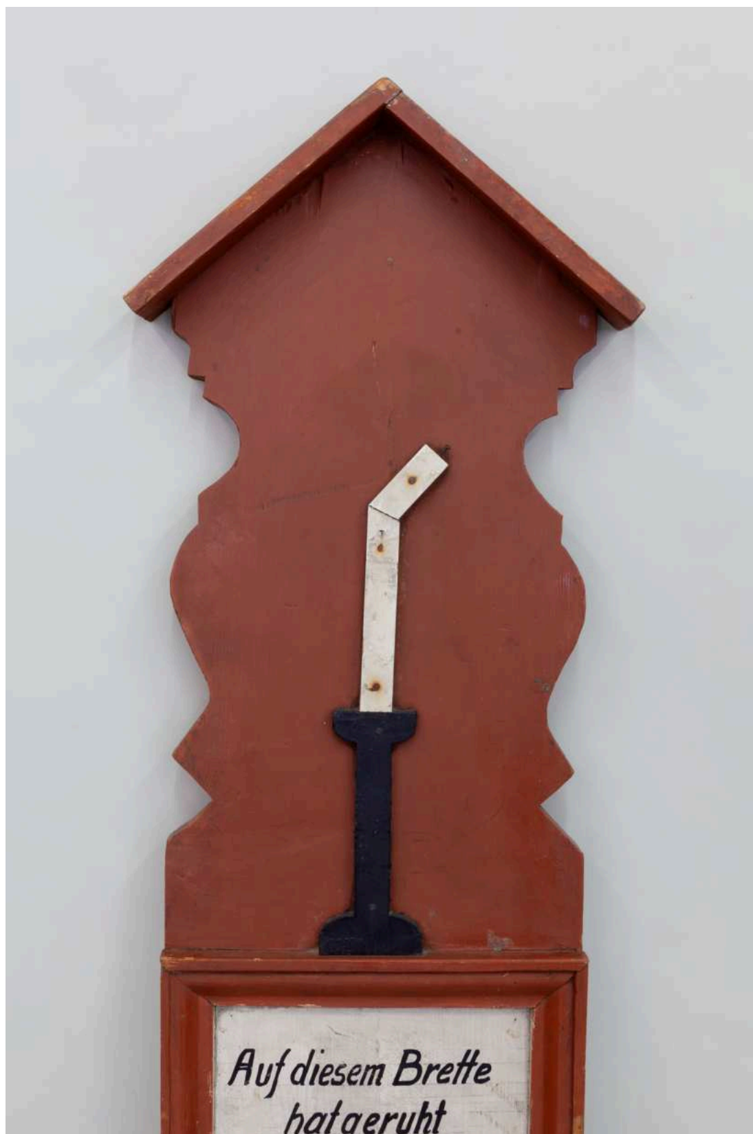
Stav před restaurováním - nástavec