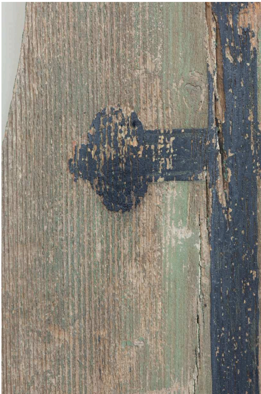
S04 - zkouška snímání prach. depositů - nástavec