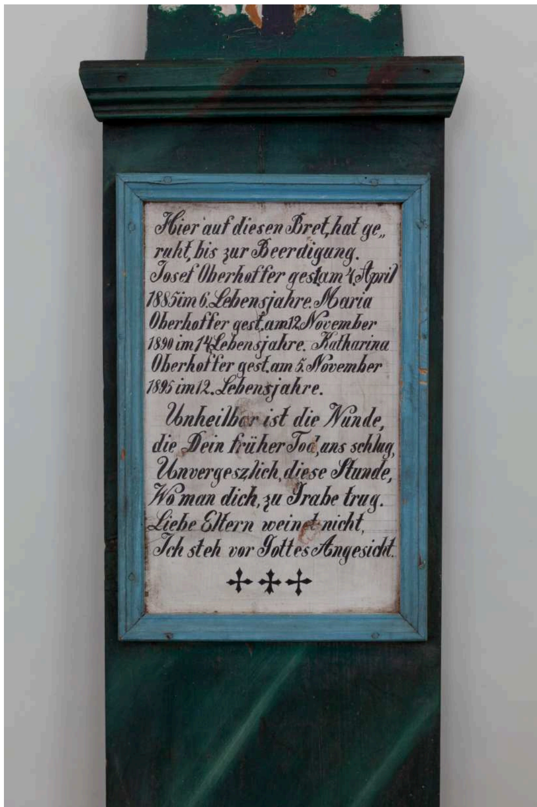
Stav před restaurováním - nápisová deska