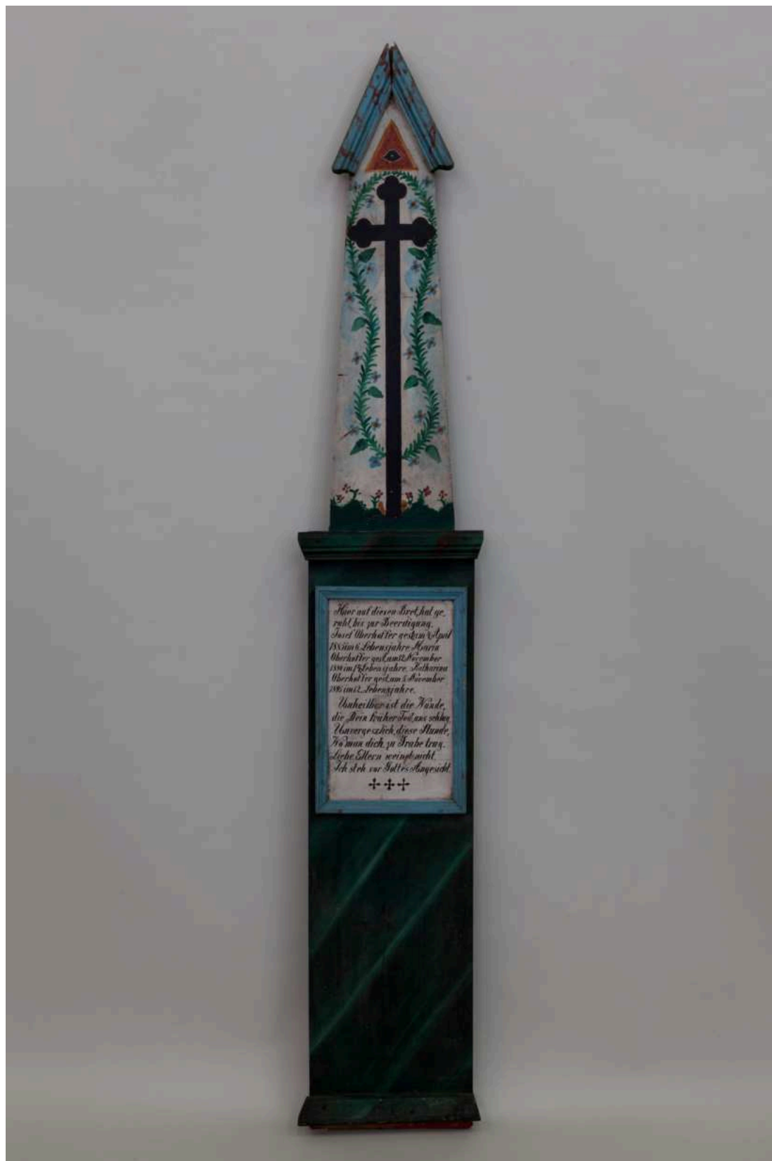
Stav před restaurováním - 231c - celkový pohled