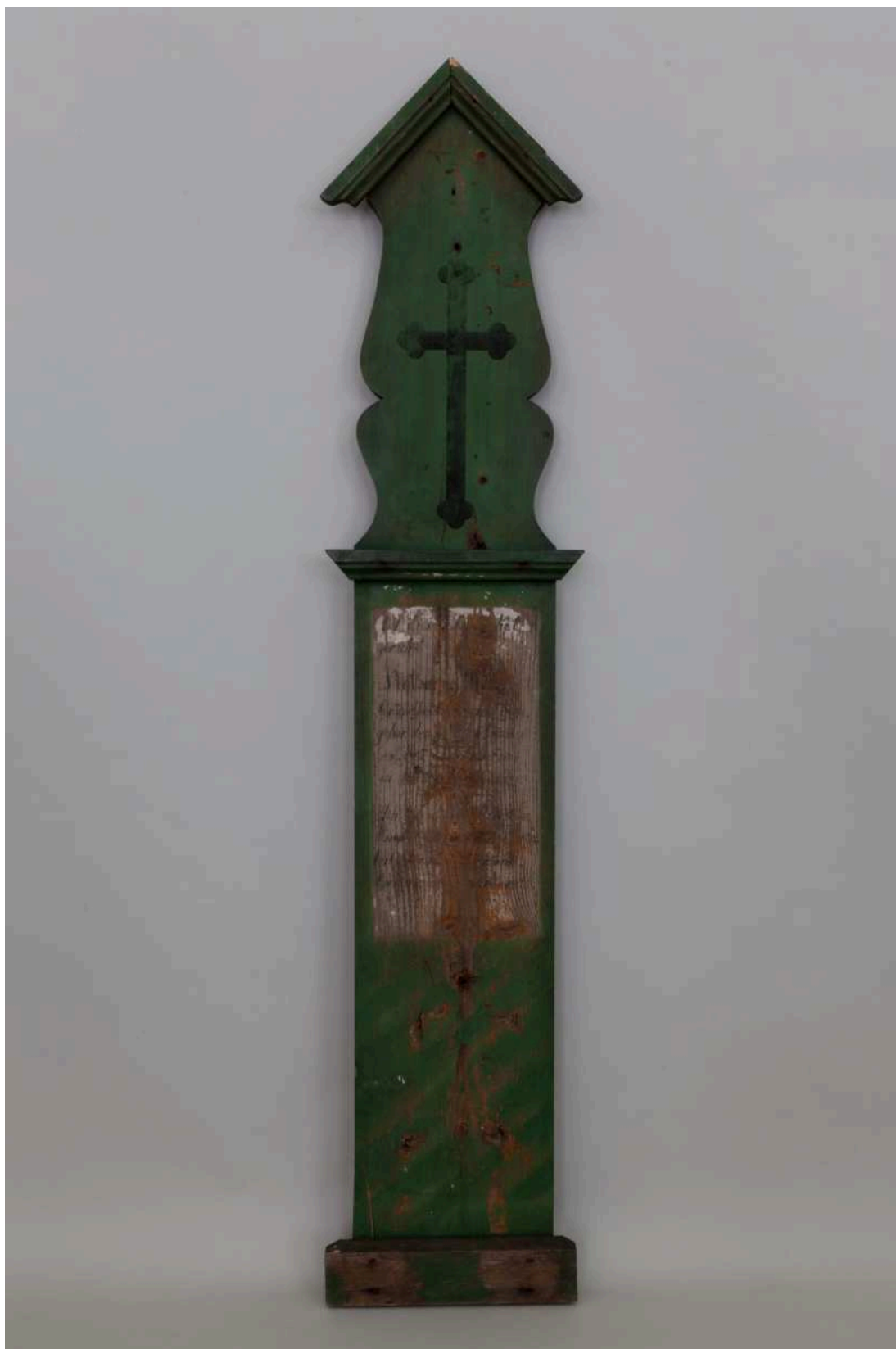
Stav před restaurováním - LU271 - celkový pohled