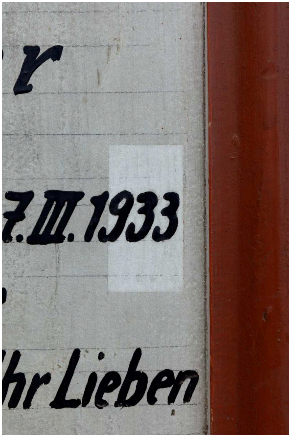
S09 - zkouška snímání prach. depositů - nápisová deska