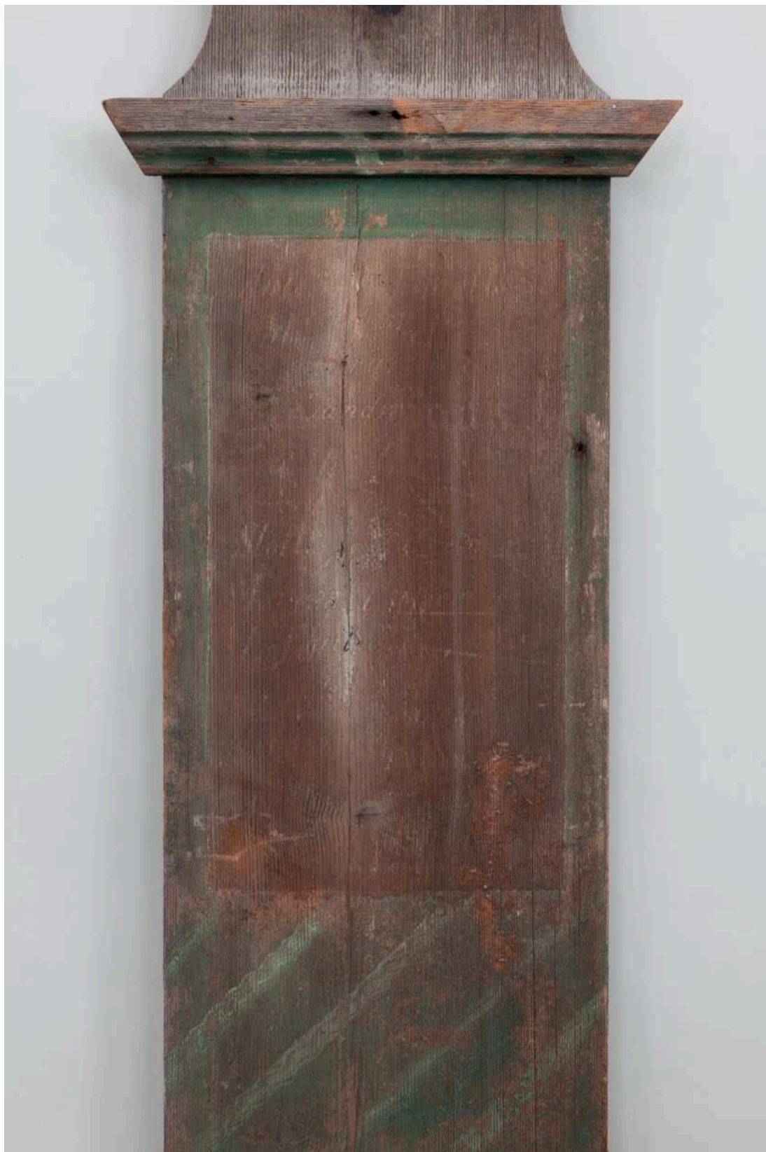
Stav před restaurováním - nápisová deska