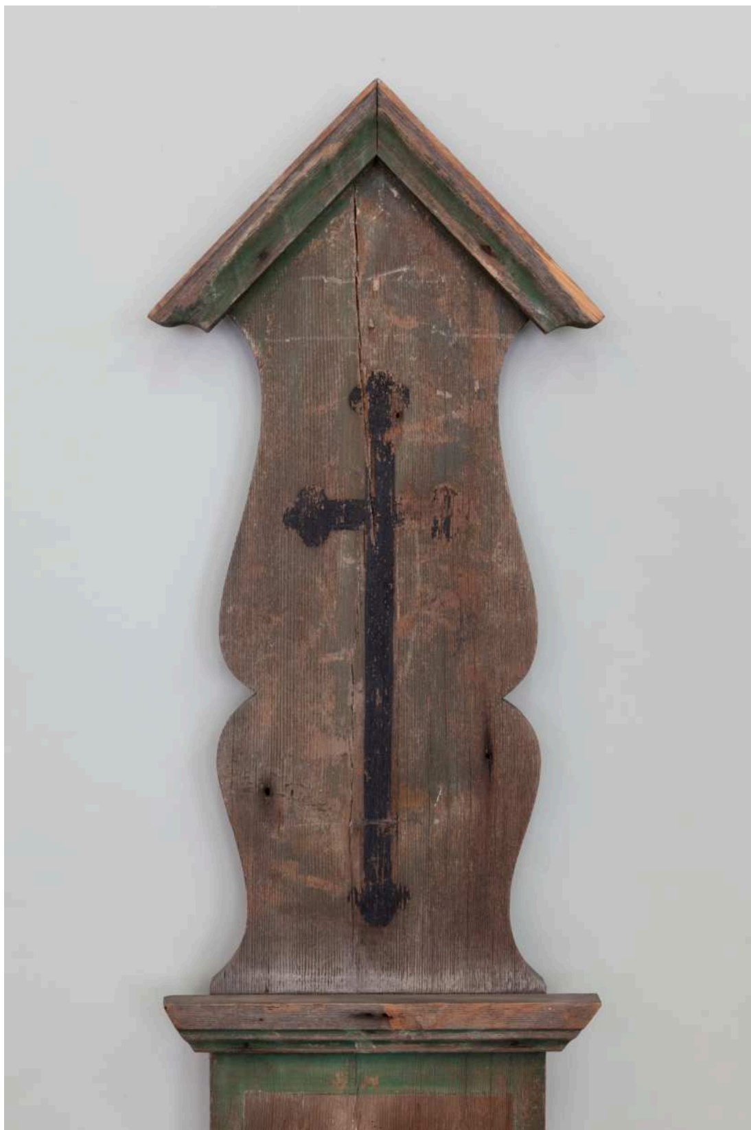
Stav před restaurováním - nástavec