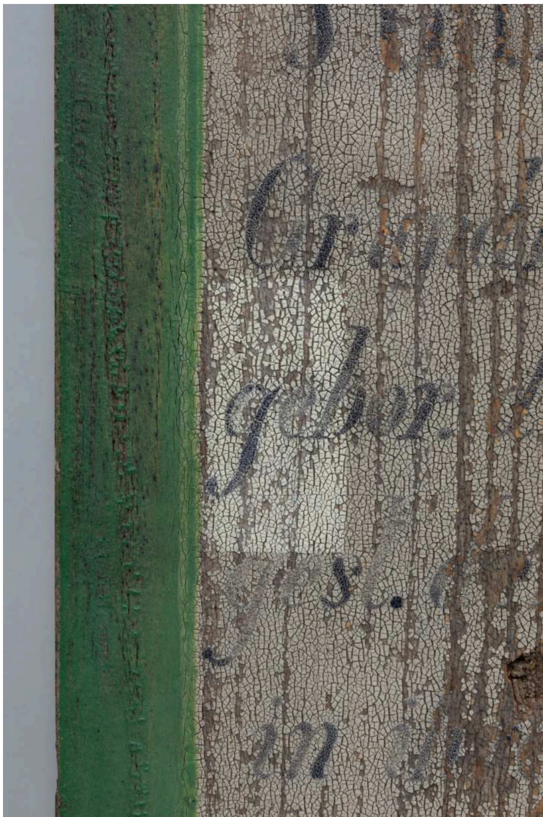
S07 - zkouška snímání prach. depositů - nápisová deska