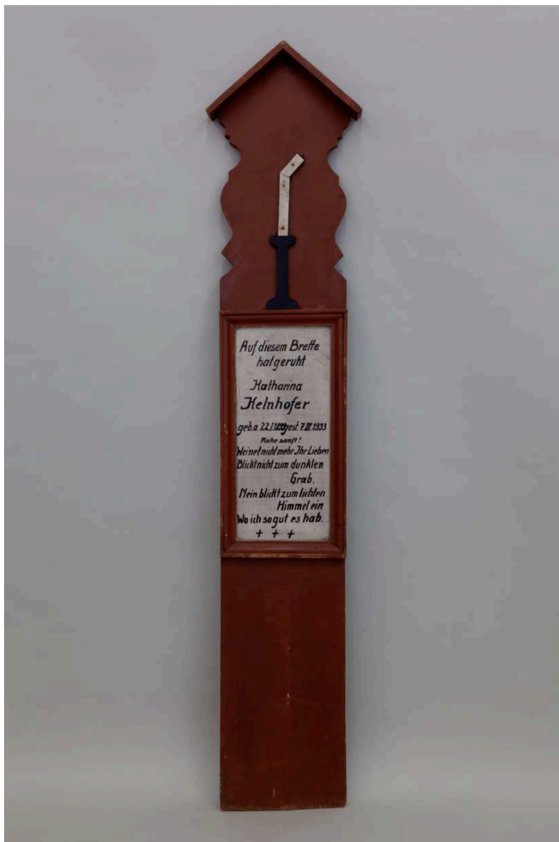
Stav před restaurováním - LU278 - celkový pohled