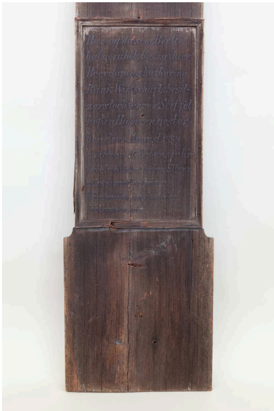
Stav před restaurováním - nápisová deska