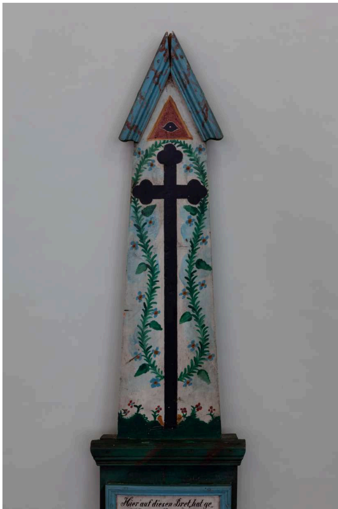
Stav před restaurováním - nástavec