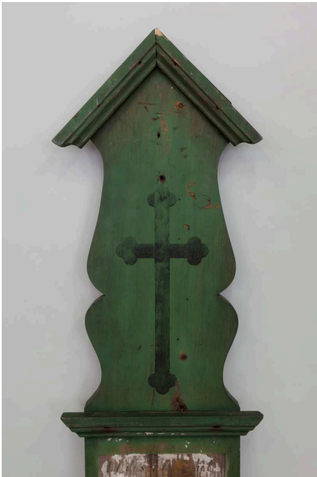
Stav před restaurováním - nástavec