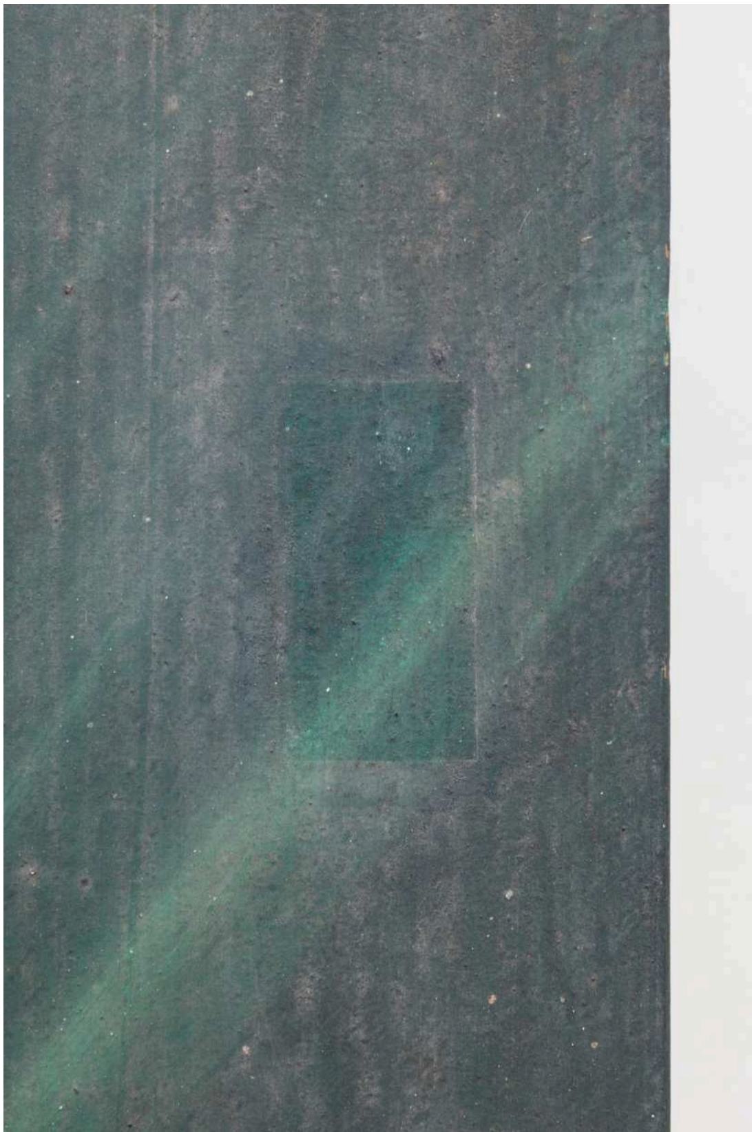
S03 - zkouška snímání prach. depositů - sokl