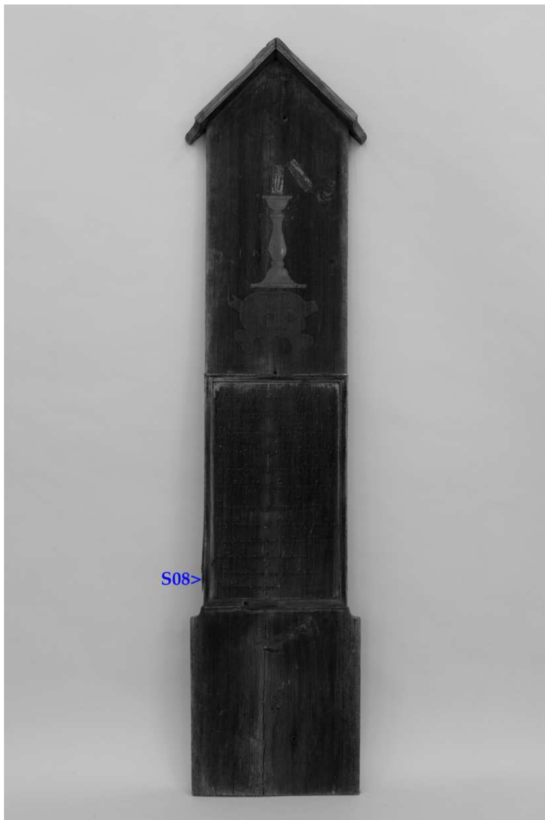
Umístění zkoušek snímání prachových depositů