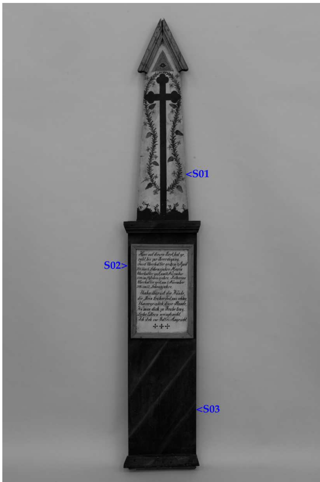
Umístění zkoušek snímání prachových depositů