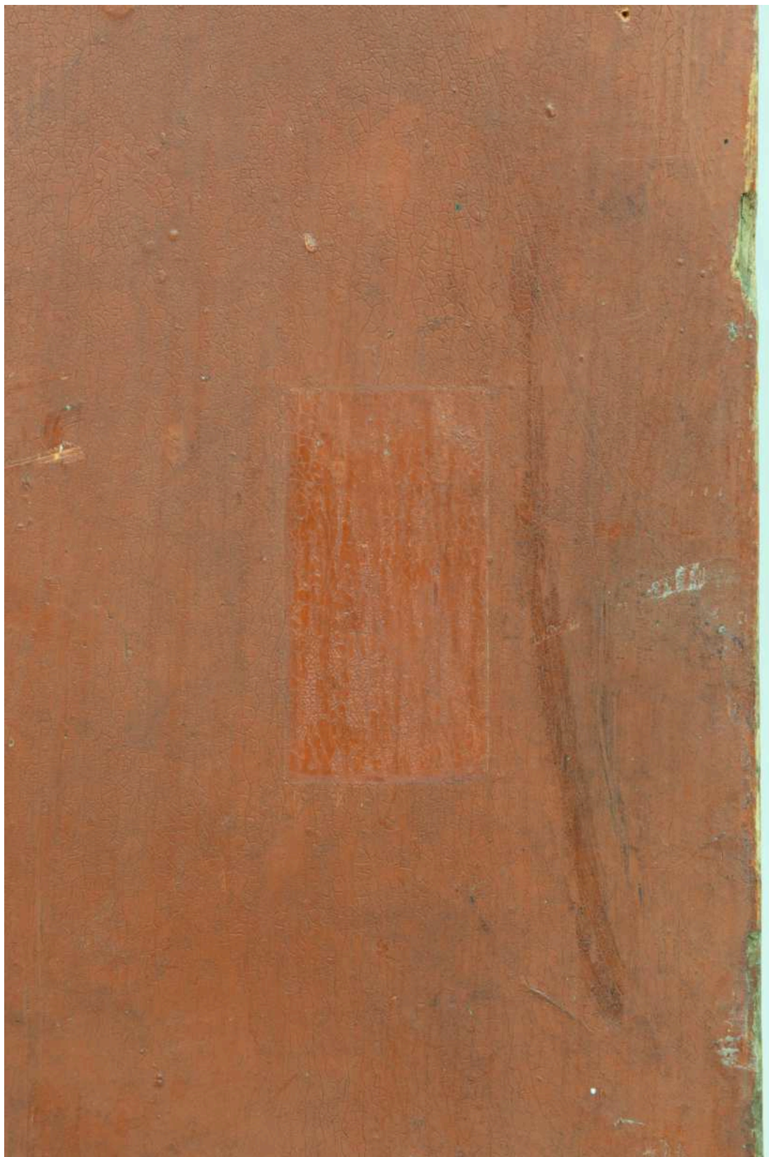
S10 - zkouška snímání prach. depositů - sokl