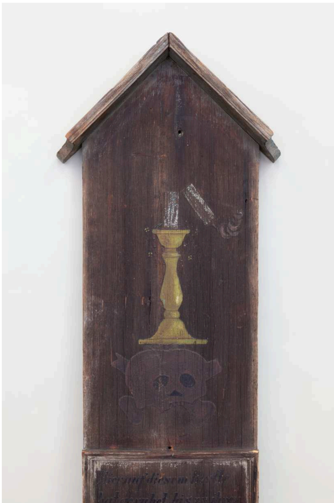
Stav před restaurováním - nástavec