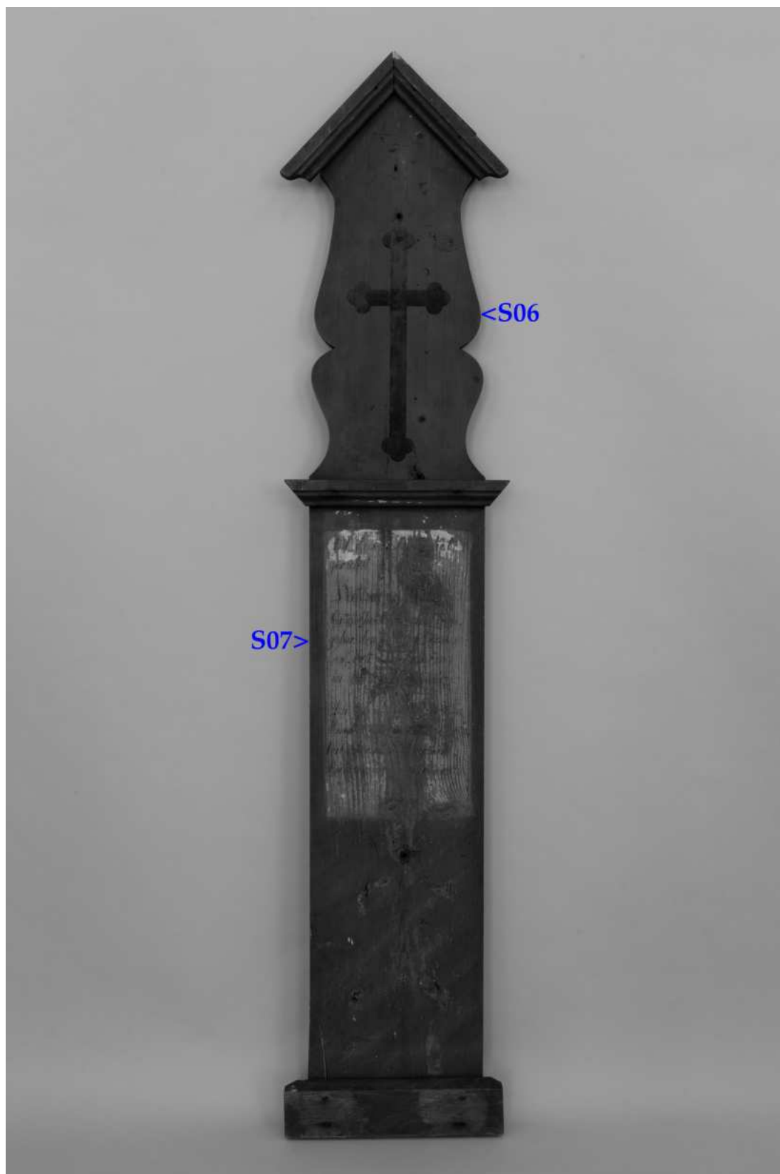
Umístění zkoušek snímání prachových depositů