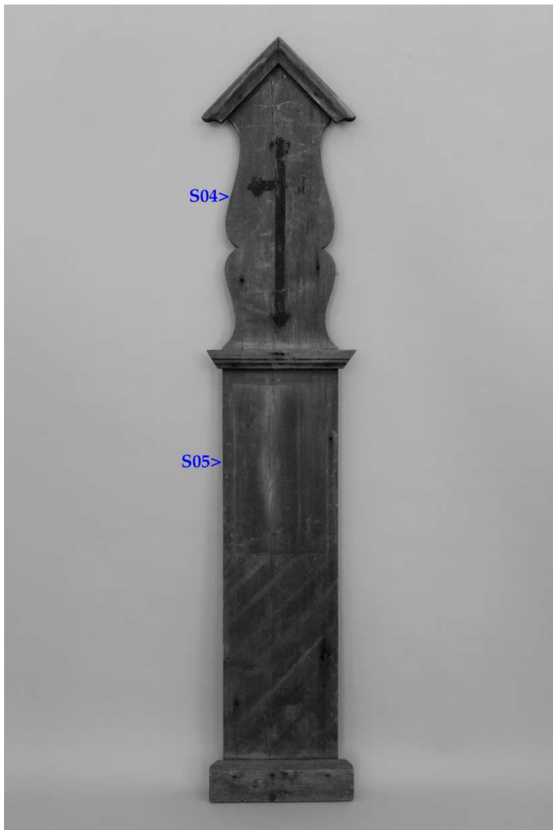
Umístění zkoušek snímání prachových depositů