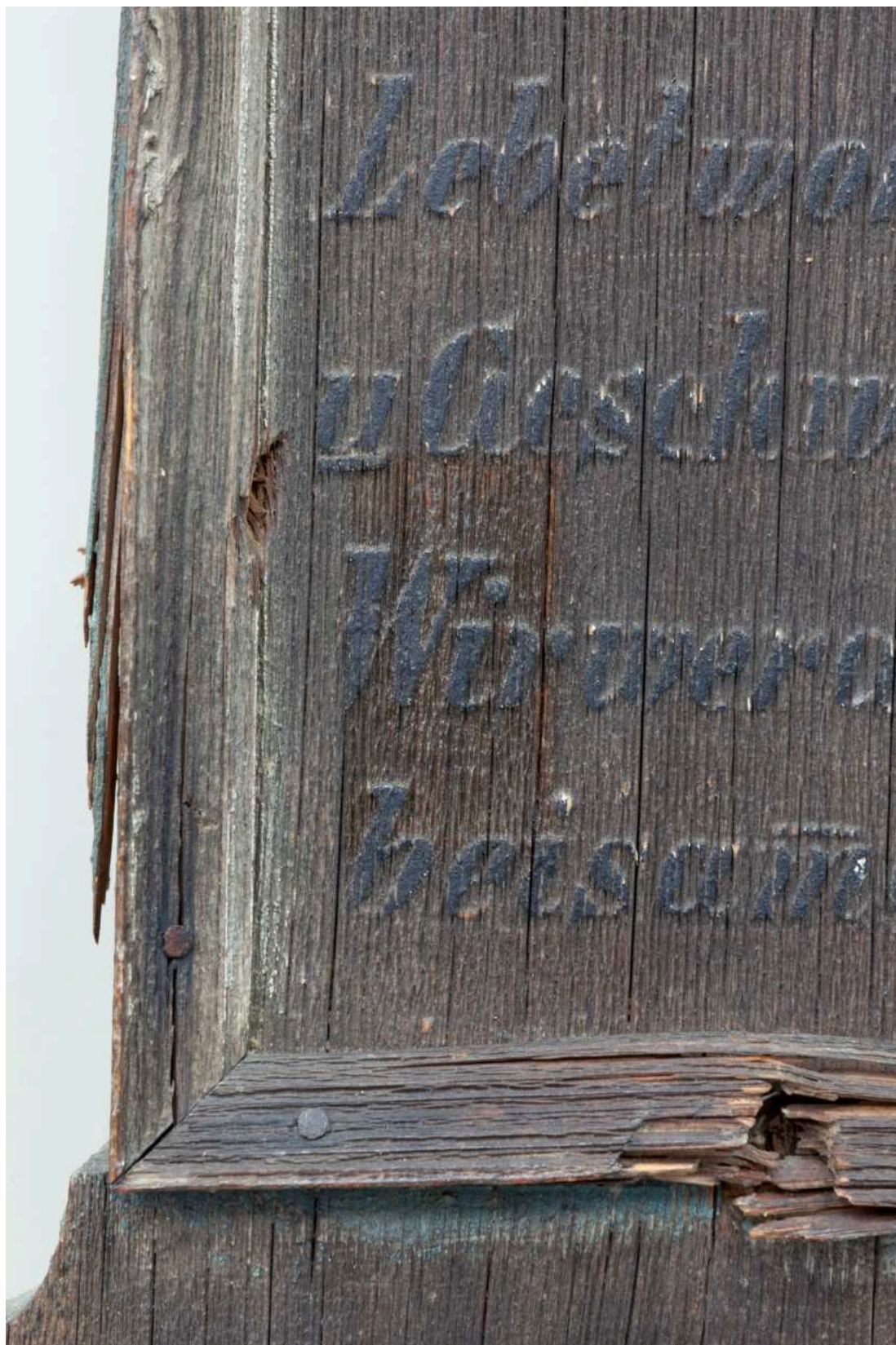
S08 - zkouška snímání prach. depositů - nápisová deska