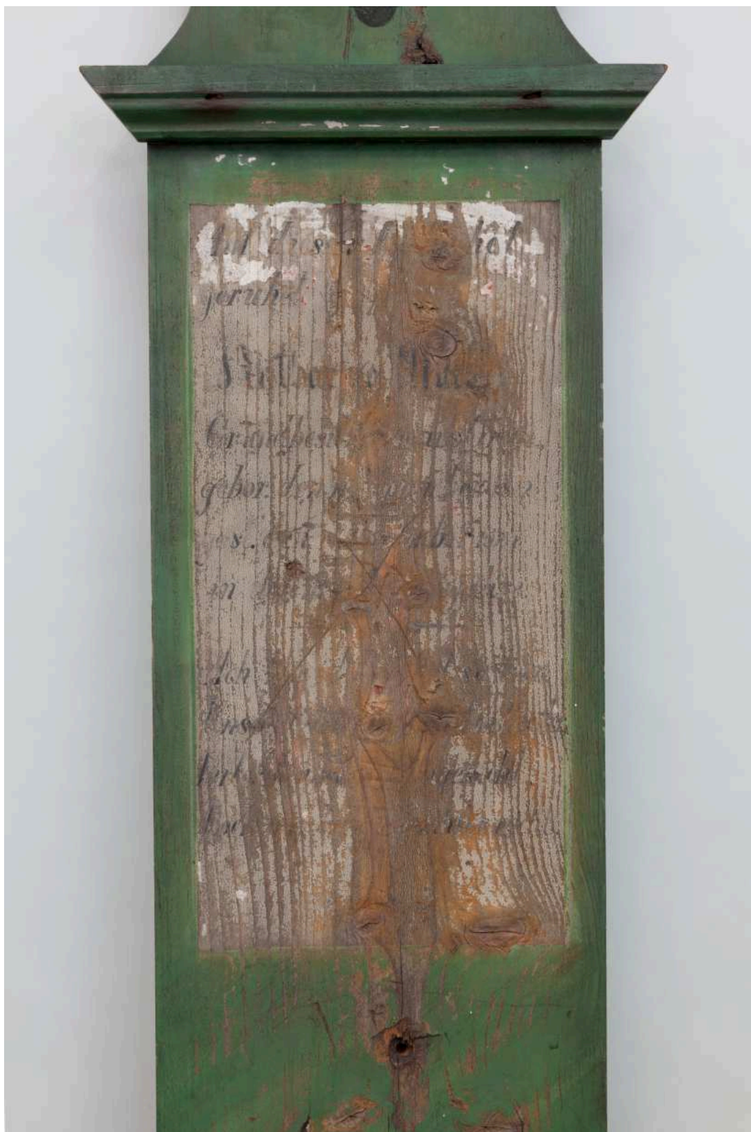
Stav před restaurováním - nápisová deska