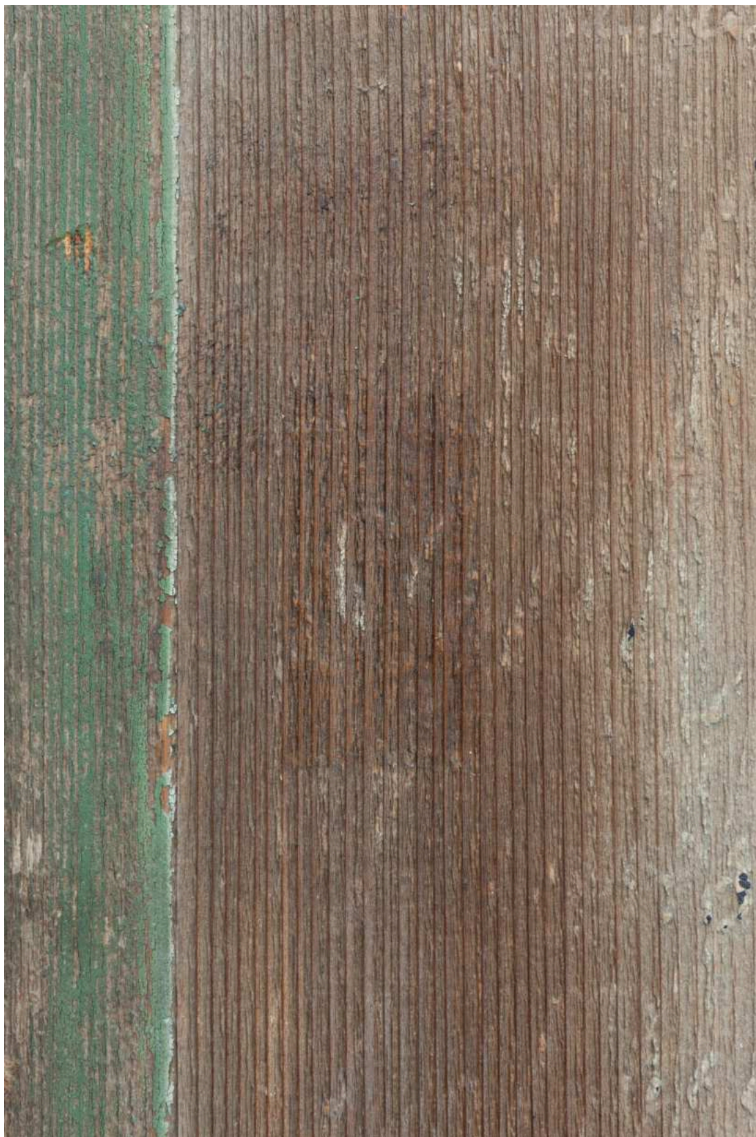
S05 - zkouška snímání prach. depositů - nápisová deska