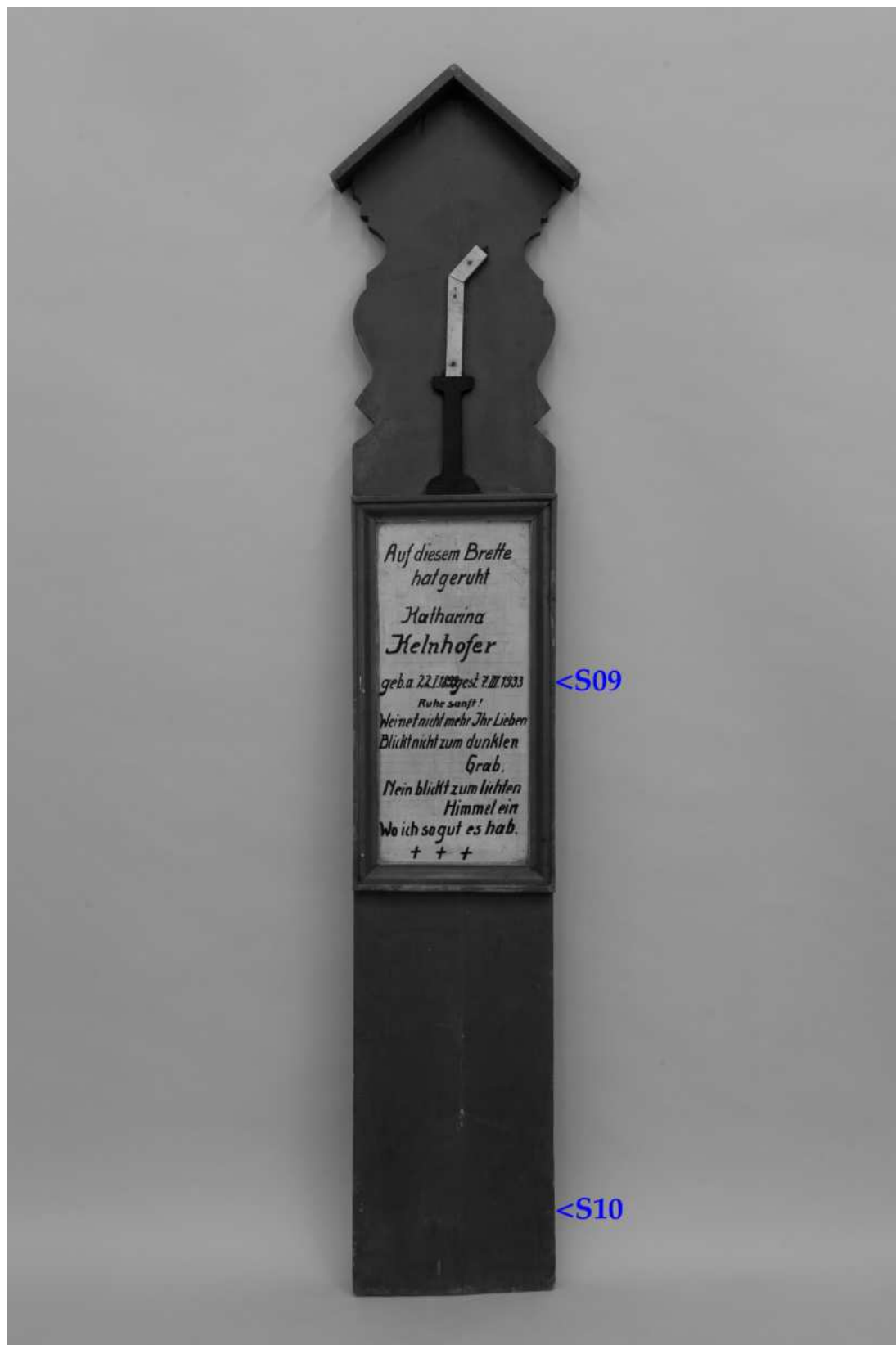
Umístění zkoušek snímání prachových depositů