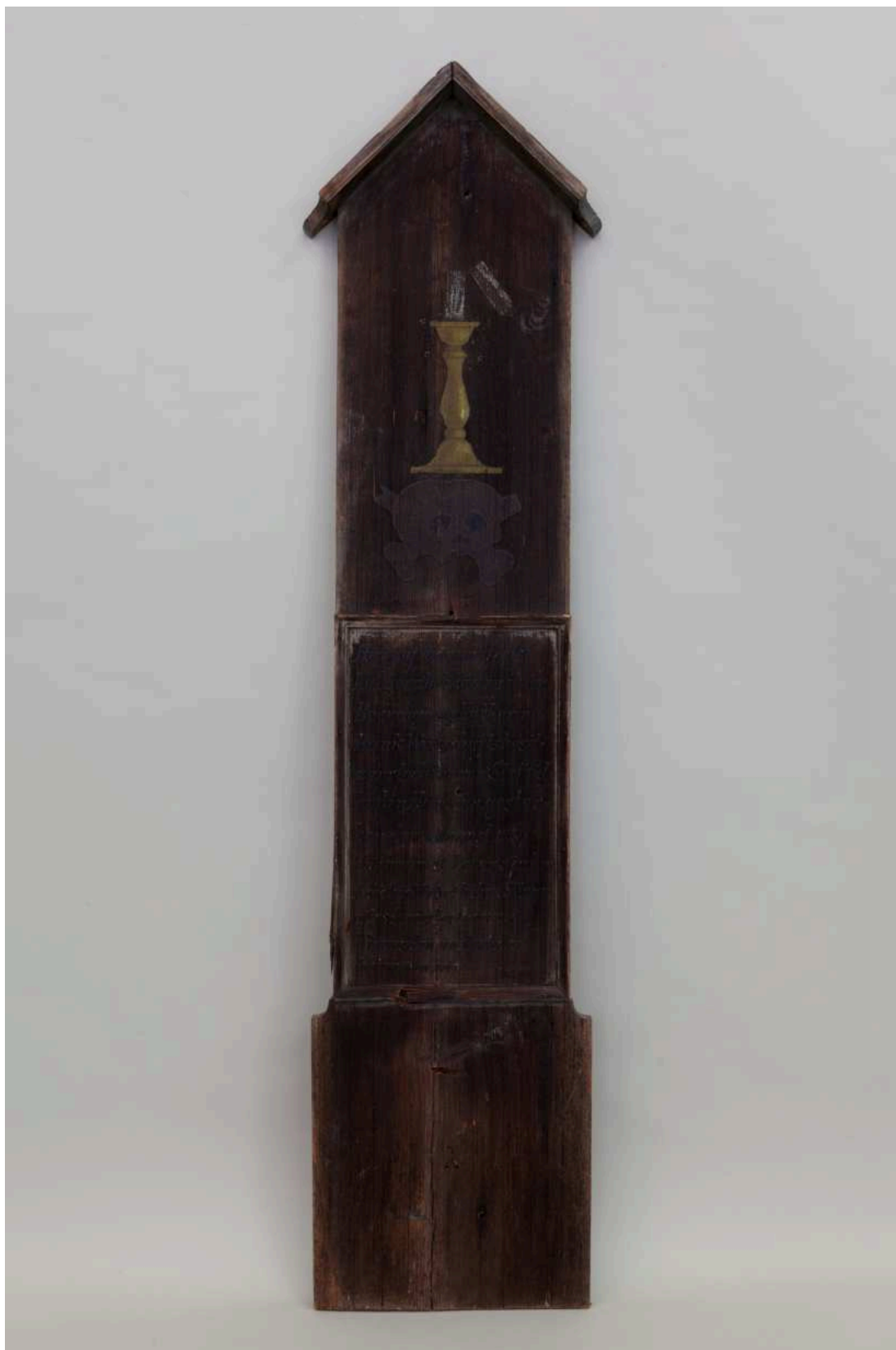
Stav před restaurováním - LU275 - celkový pohled