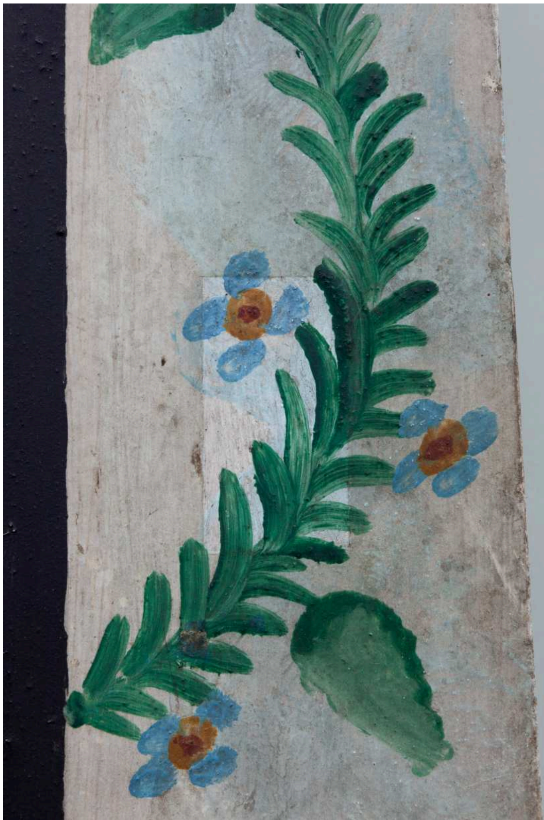
S01 - zkouška snímání prach. depositů - nástavec