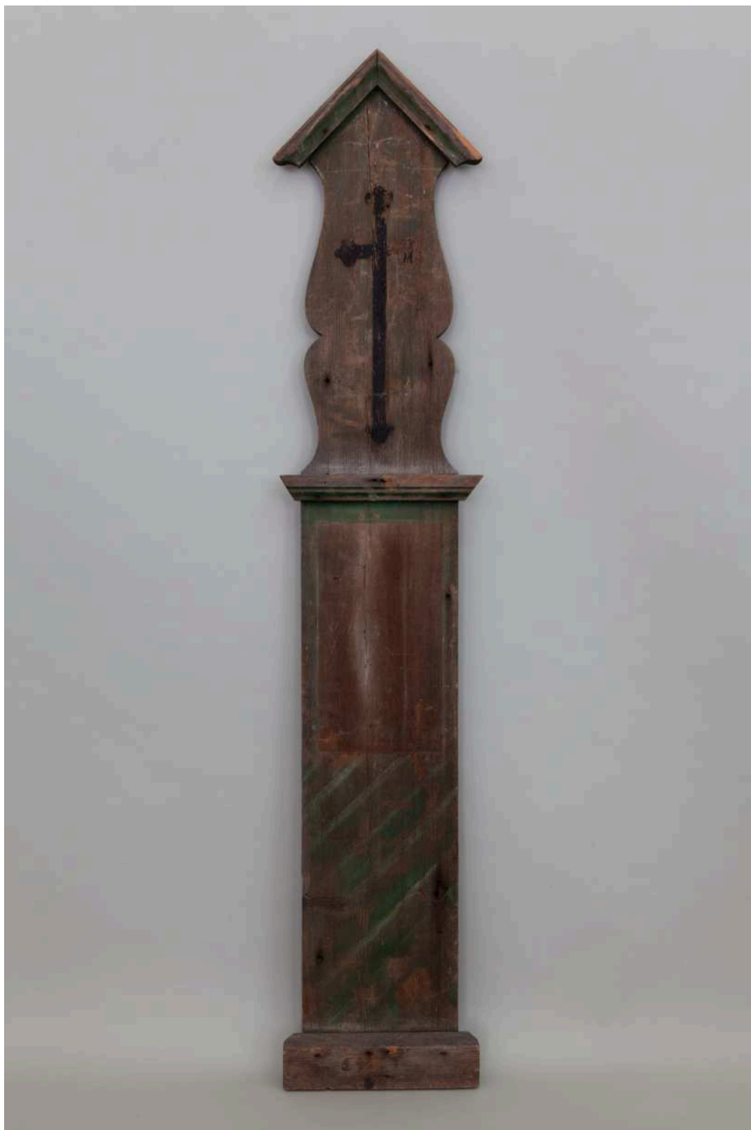
Stav před restaurováním - LU268 - celkový pohled